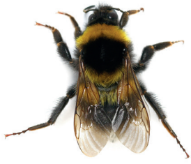
Bourdon terrestre ( Bombus terrestris )