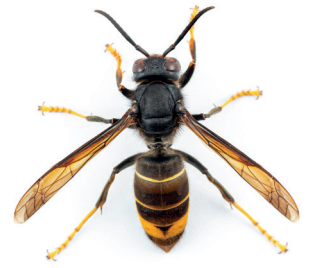
Frelon asiatique ( Vespa velutina )