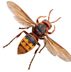
Frelon européen ( Vespa crabro )