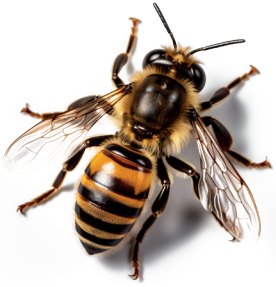
Abeille domestique ( Apis mellifera )