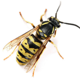
Guêpe commune ( Vespula vulgaris )